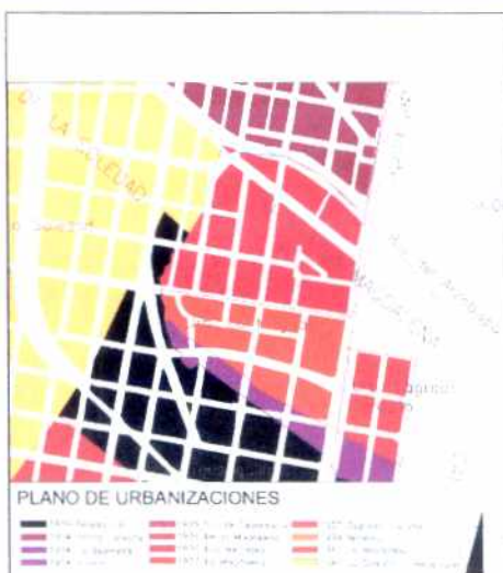
PLANO DE URBANIZACIONES