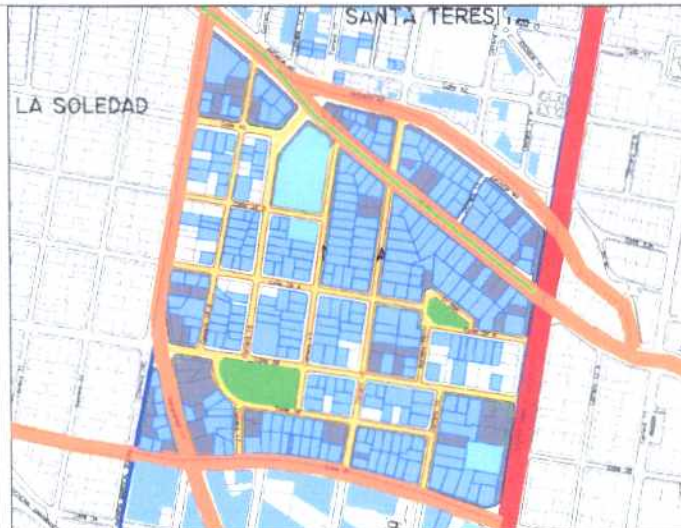
Inmuebles de Interés Cultural - MORFOLOGÍA EN PLANTA